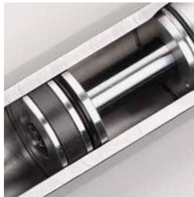
Hubzylinder – Von A-dec entworfen und mit robuster Hydraulik und weniger Bauteilen konstruiert.