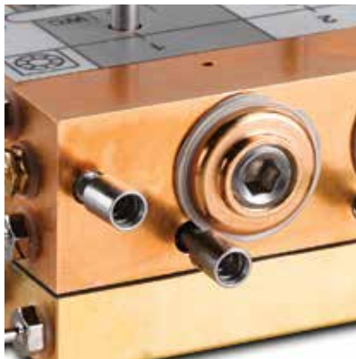
Steuerblock – Durch die patentierte Konstruktion steht bei jeder Aktivierung sauberes Behandlungswasser bereit.

A-dec hat mit der Herstellung von Geräten mit höchster Verlässlichkeit und Qualität einen guten Ruf aufgebaut. Dieser gute Ruf rührt vom Streben nach Güte und dem Engagement für innovative und doch einfache technische Konstruktionen. Das bedeutet, dass Sie auf einfache Instandhaltung und eine lange Lebensdauer der Produkte zählen können.