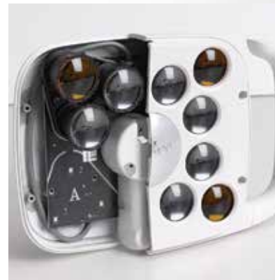
A-dec LED-Lampe – Der preisgekrönte, geräuschlose Aufbau beinhaltet eine einzigartige „passive Kühlung“, die Wärme ohne Ventilator abführt.