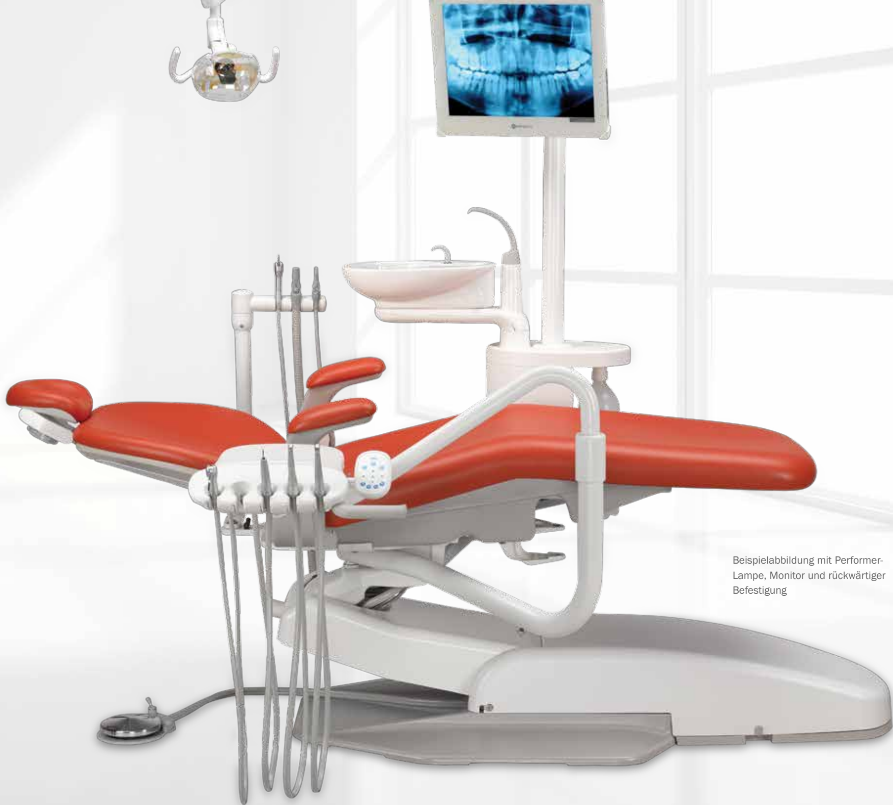
Beispielabbildung mit Performer-Lampe, Monitor und rückwärtiger Befestigung