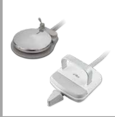
Fußbedienung mit Tretscheibe oder Schieber