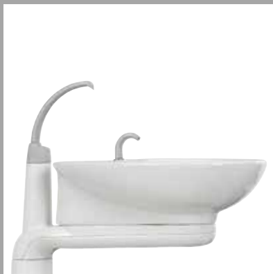
Drehbare Glaskeramik-Speibecken erhältlich