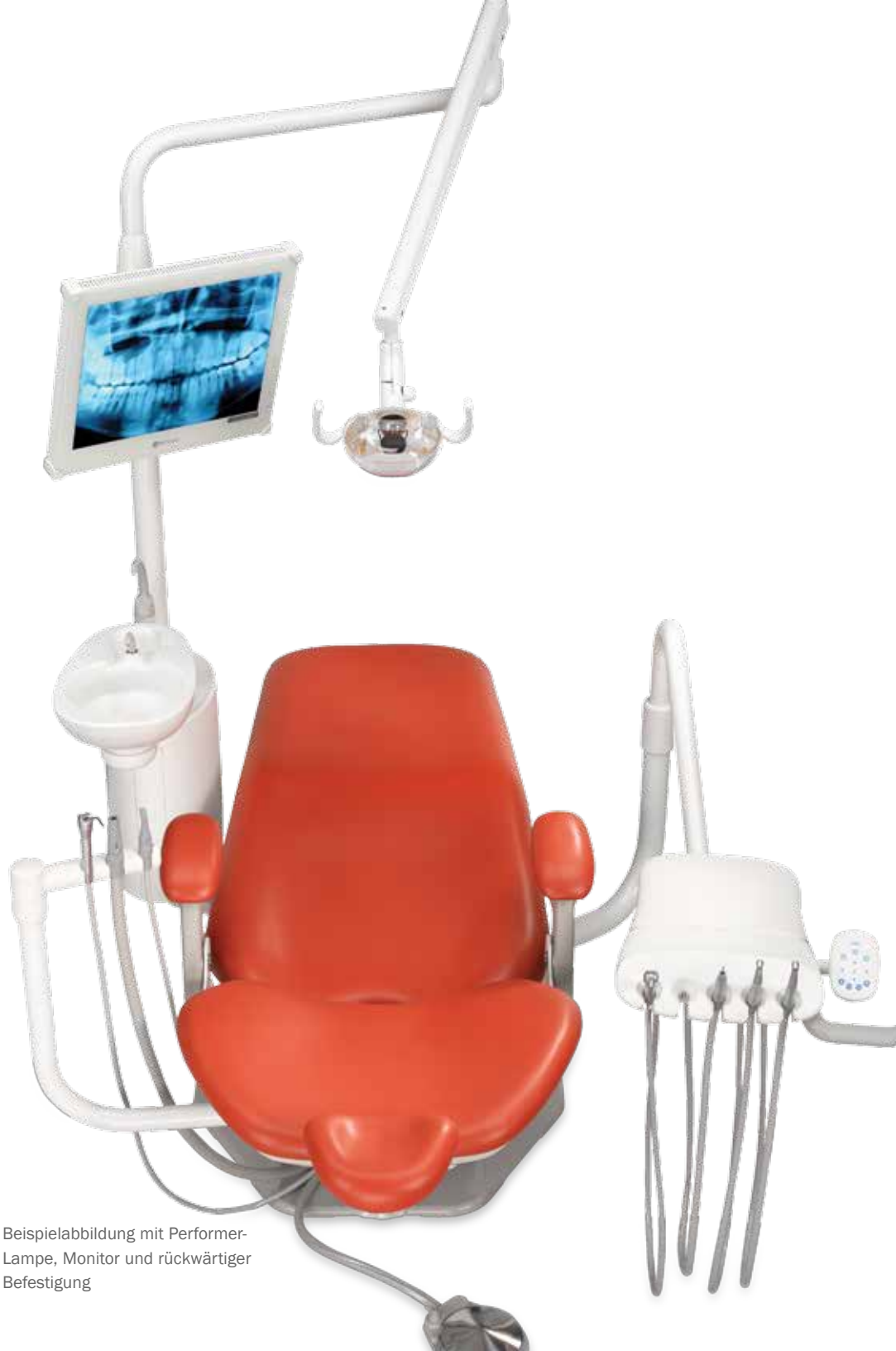
Beispielabbildung mit Performer-Lampe, Monitor und rückwärtiger Befestigung