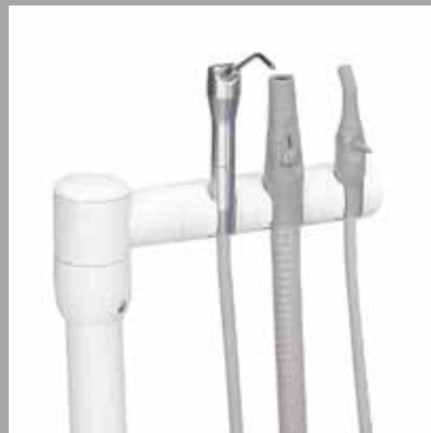
Dreifach positionierbarer Halter für Assistenteninstrumente mit Dürr Hochleistungsabsauger (HVE), Speichelsaugerhalterung und optional mit Spritze